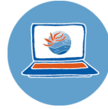
Activitat física i ciència