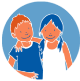
Tota la ESO